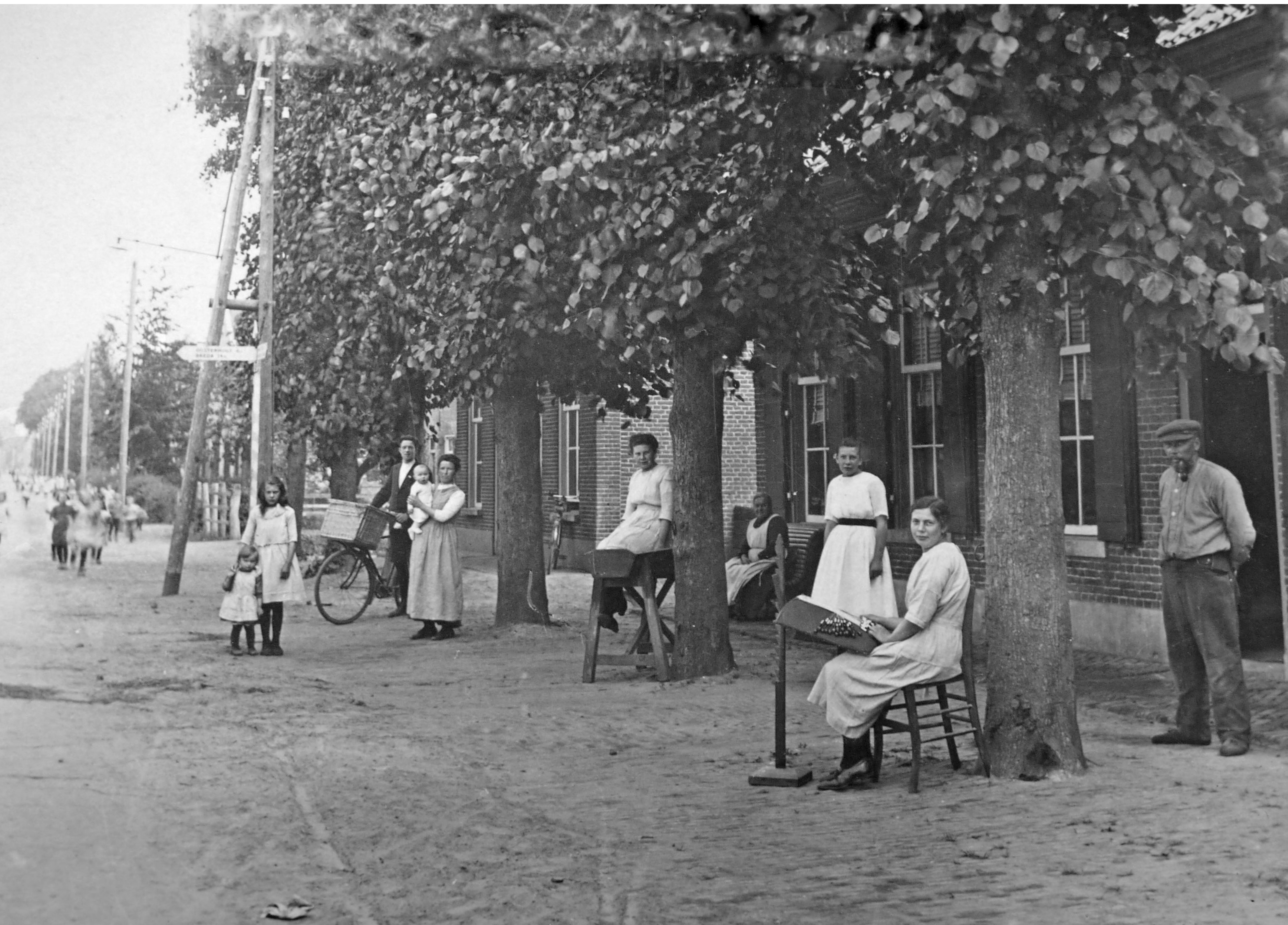
Gedeelten uit het artikel van dominee W. N. Wolterink