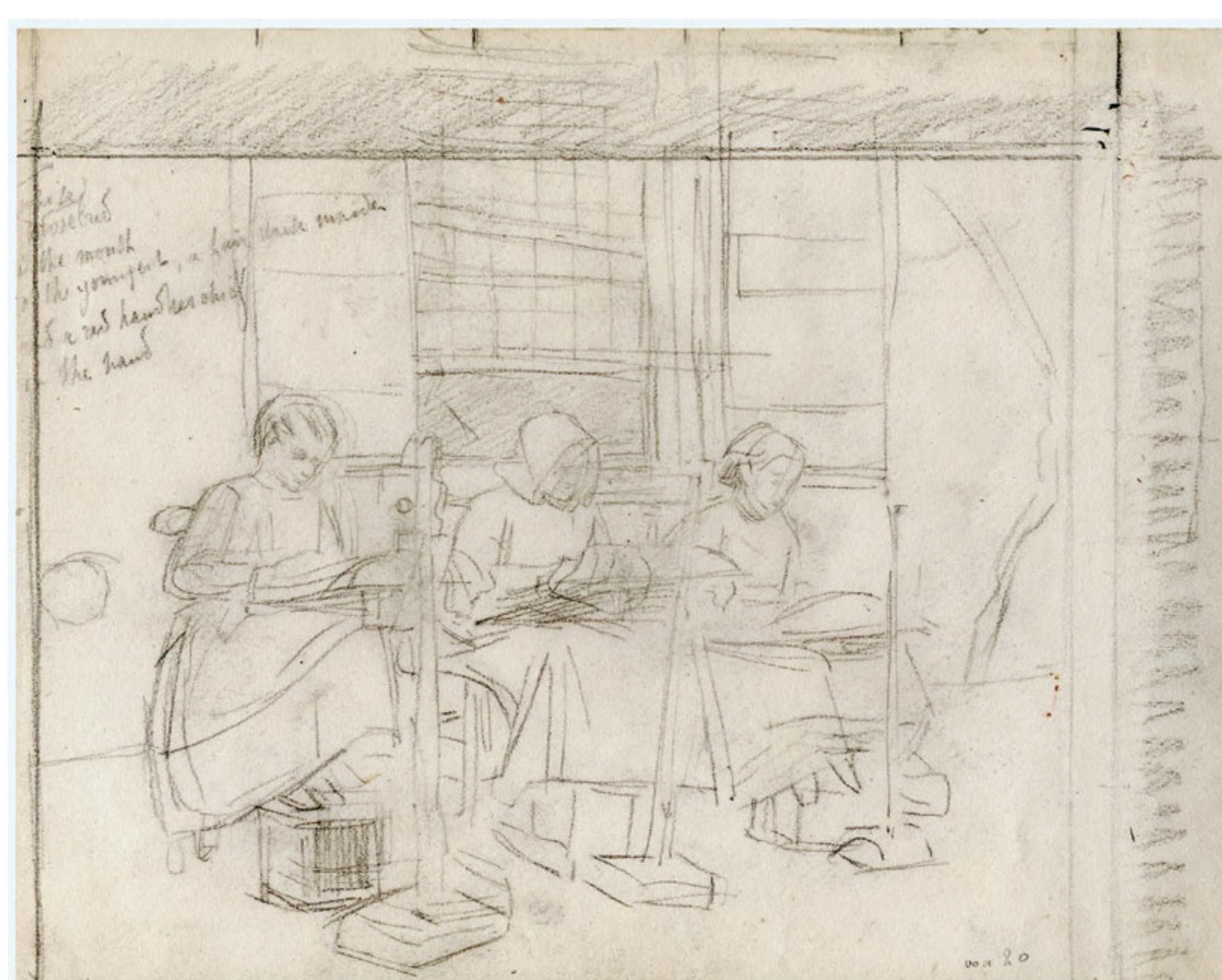
Schets van Jan Veth